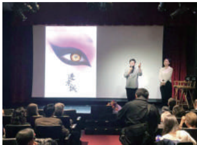
胡玫导演在纽约放映现场讲述影片拍摄幕后的故事