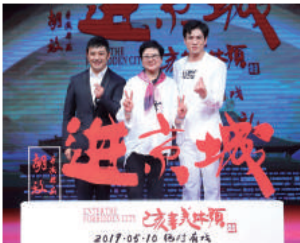
导演胡玫与富大龙马歌涵“比爱心”合影

从四大徽班的诞生地安徽,到清代戏曲繁荣之地扬州,再至百戏入京朝圣的北京,甚至大洋彼岸的纽约和洛杉矶,将于5月10日 上映的影片《进京城》正在全球各地掀起一阵唱响中国传统文化之美的国粹新潮。