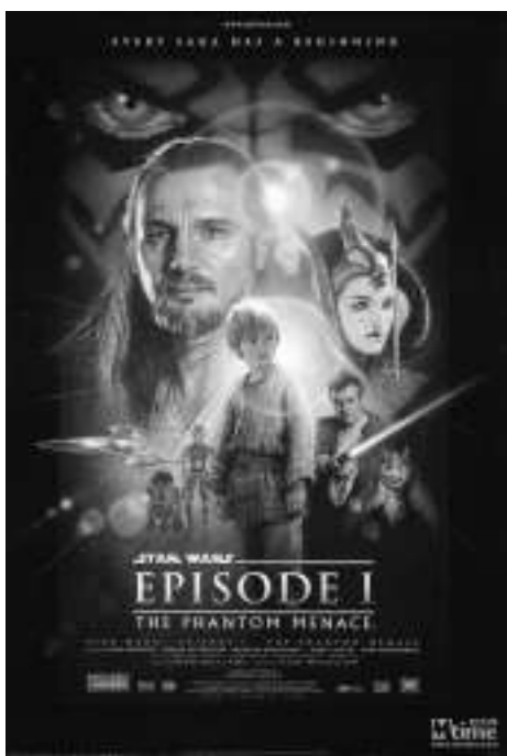
1999-《星球大战前传1:幽灵的威胁》