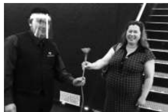
Cine Magaly 影院员工向观众献上表示欢迎的花