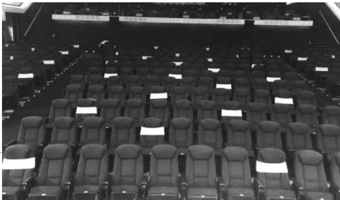
Cine Magaly 影院的社交安全距离标签