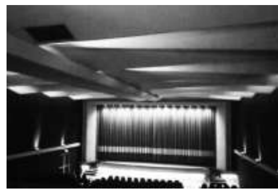
Cine Magaly 电影院

Cine Magaly影院较小的那个厅有72个座位，这个厅于5月15日(周五)以25%的票房(18个座位)的规模开放，交