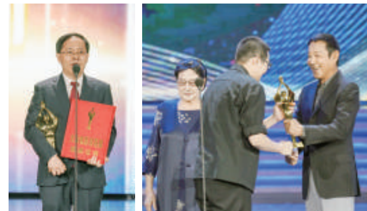
《我和我的祖国》领奖