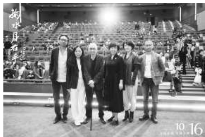
影院复工以来,《活着唱着》、《掬水月在手》等影片于全国艺联专线上映

发展硕果,离不开国家政策的大力支持。2018年6月,国家电影资金办依据《财政部关于调整中央级国家电影事业发展专项资金使用范围和分配方式的通知》,明确了对放映国产艺术影片的影院和发行国产艺术电影的发行单位给予资助的政策。