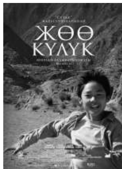
吉尔吉斯斯坦:《冲向天际》