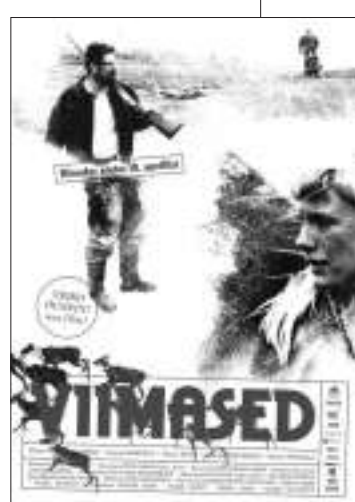
爱沙尼亚:《最后的人》