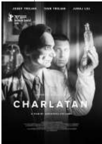
捷克共和国:《江湖郎中》