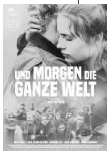
德国:《明天整个世界》