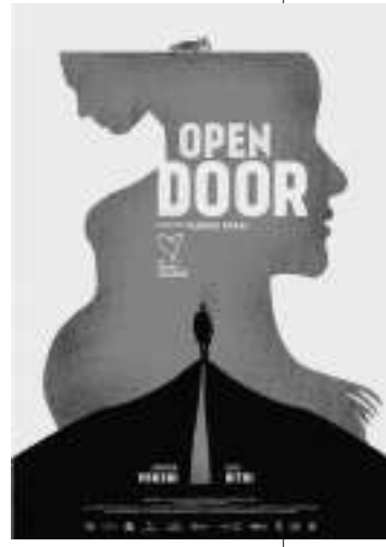
阿尔巴尼亚:《开门吧》