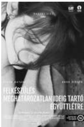
匈牙利:《未知时间的爱》