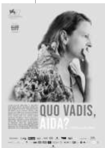
波斯尼亚和黑塞哥维那:《艾达怎么了》

► 阿尔巴尼亚:《开门吧》(Open Door) , 弗洛伦斯·帕帕斯 (Florence Papas)