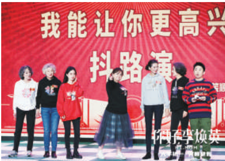
《你好,李焕英》线上直播路演活动现场