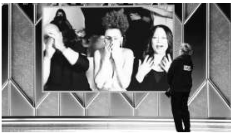
安德拉·戴成为35年以来首位获得剧情片最佳女主角的黑人女演员