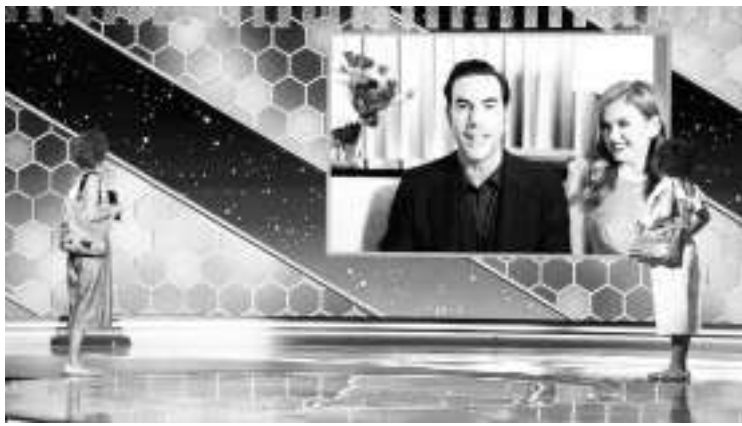
萨莎·拜伦·科恩获音乐/喜剧片最佳男主角奖

《无依之地》在2月28日的第78届金球奖颁奖典礼上赢得了最佳剧情片奖,赵婷成为了继1984年凭借《燕特尔》(Yentl)获最佳导演奖的芭芭拉·史翠珊(Barbra Streisand)之后,近40年以来唯一一位获得该奖项的女导演。这部影片也让探照灯影业在金球奖颁奖典礼上收获颇丰。