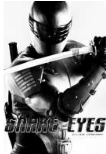
派拉蒙-《特种部队:蛇眼起源》