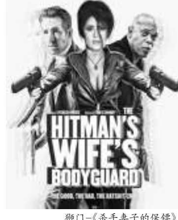
狮门-《杀手妻子的保镖》