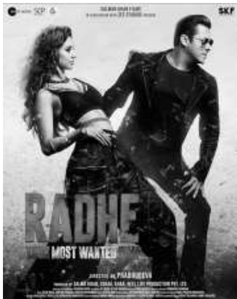
《拉德:你最想要的斋戒》