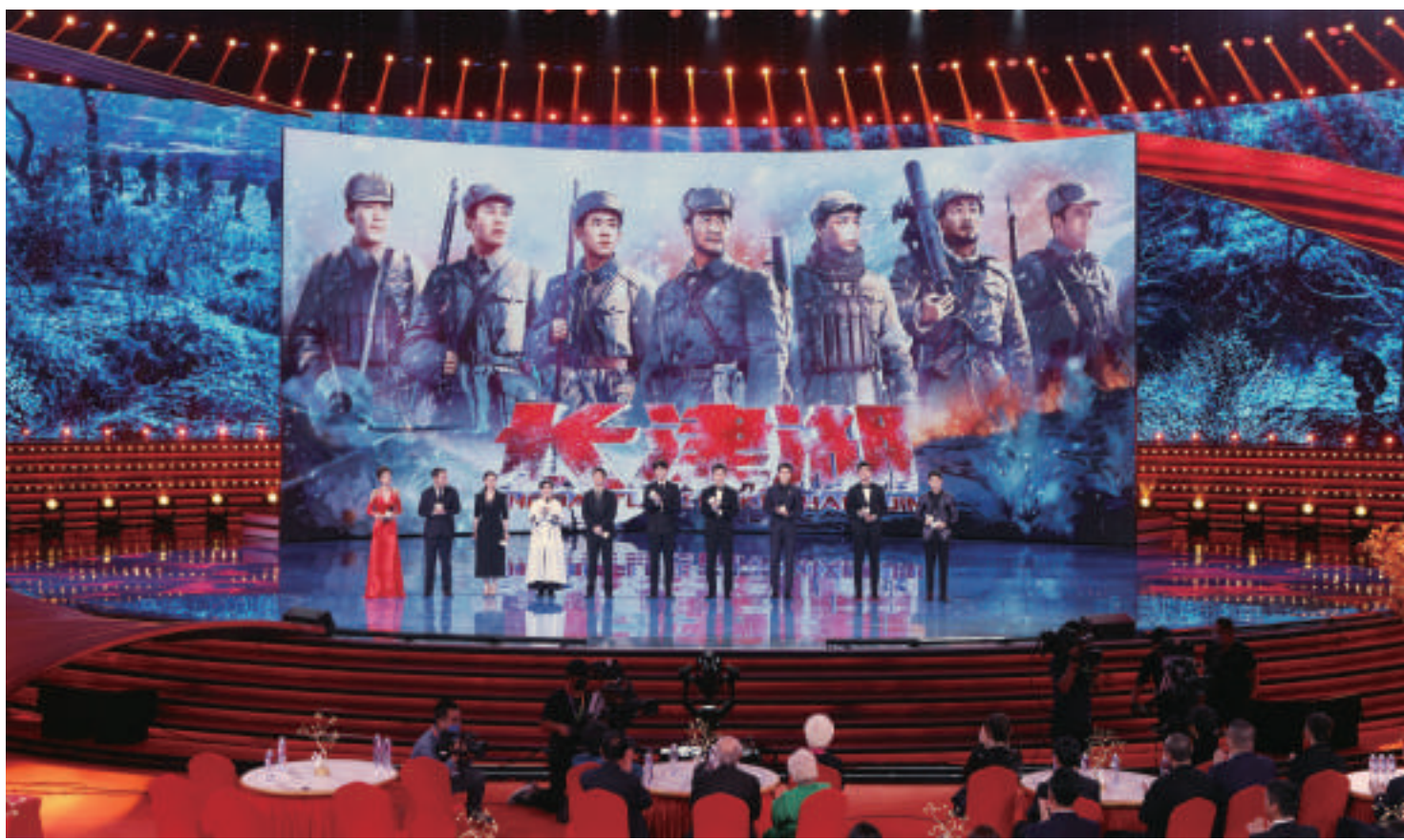
开幕影片《长津湖》主创亮相