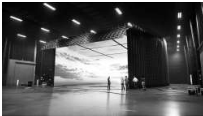
Trilith公司的虚拟视觉渲染,这将在现场实时完成视觉特效工作

电影公司高管和摄影棚运营商表示,布景的建造成本至少比去年高出15%。“我们问,‘这个场景只占到剧本一页的八分之七。我们需要花费50万美元来布景吗?’”