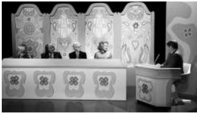
朱莉娅·罗伯茨在《煤气灯》中