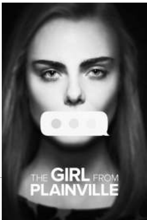
《来自普莱恩维尔的女孩》

几位从零开始搭建布景的摄影棚运营商表示,包括木材、金属和某些织物在内的原材料成本比年初至少高出30%。有些材料的价格翻了