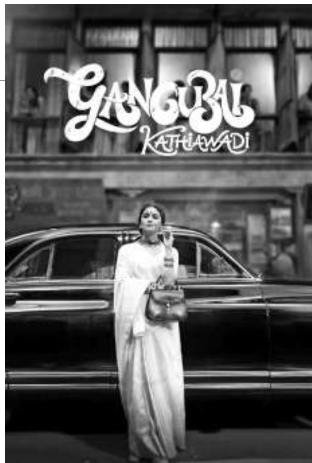
《甘古拜·卡蒂娅瓦迪》

当 Yash Raj 影业的《沙姆谢拉》(Shamsher) 7月22日在印度上映,孟买印地语电影业(俗称宝莱坞)的所有人都密切关注这部影片的上映。