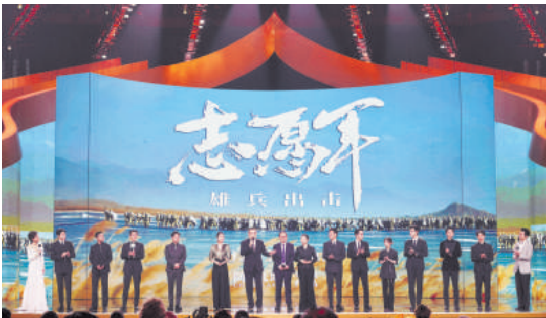
《志愿军·雄兵出击》剧组亮相

影节以“光影共享,文明互鉴”为主题,是对习近平总书记今年3月首次提出的全球文明倡议的积极响应。新时代的北京传统与现代交融,光荣与梦想同行。北京国际电影节风格独具、气质不凡,在向世界讲好中国故事和推动首都文化建设上发挥着独特作用。总台将以影像为桥,同心笃行,讲好中国故事,与各国朋友一起共绘文明互鉴新画卷。