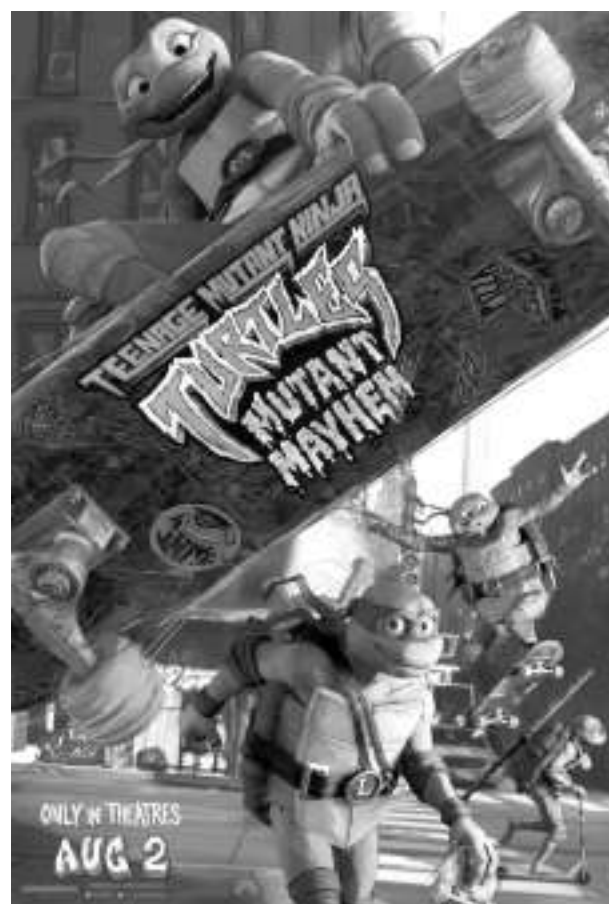
《忍者神龟:变种大乱斗》